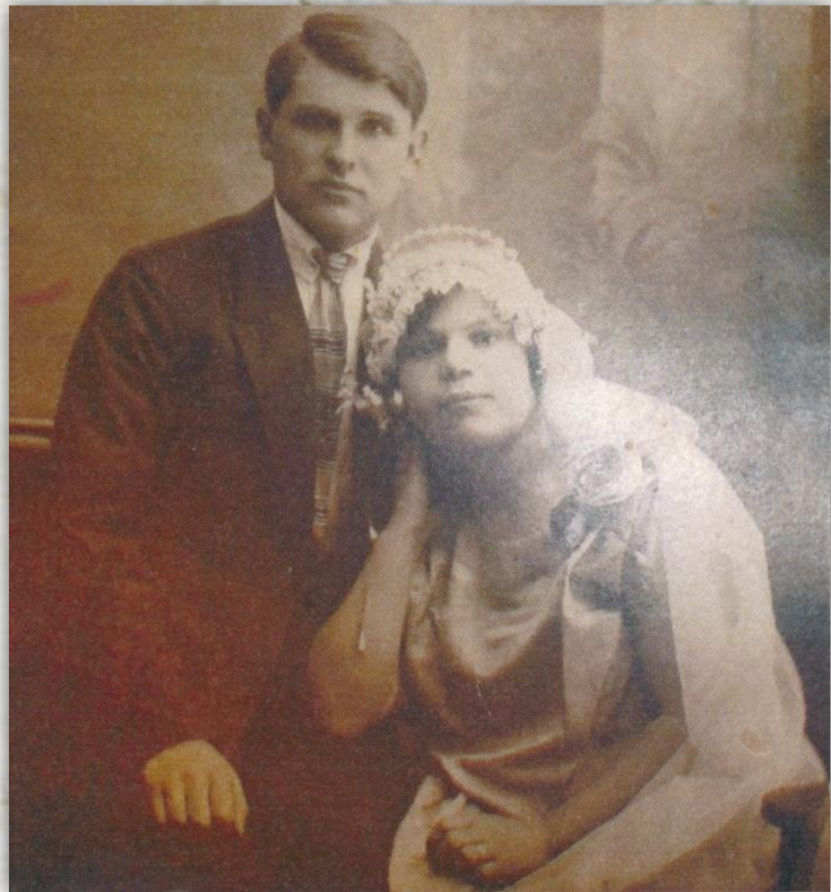
Нювобрачные, 1928 г.