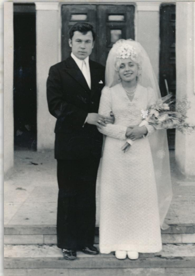
Новобрачные, 1975 г. ф.151, оп.1, д.5, л.2