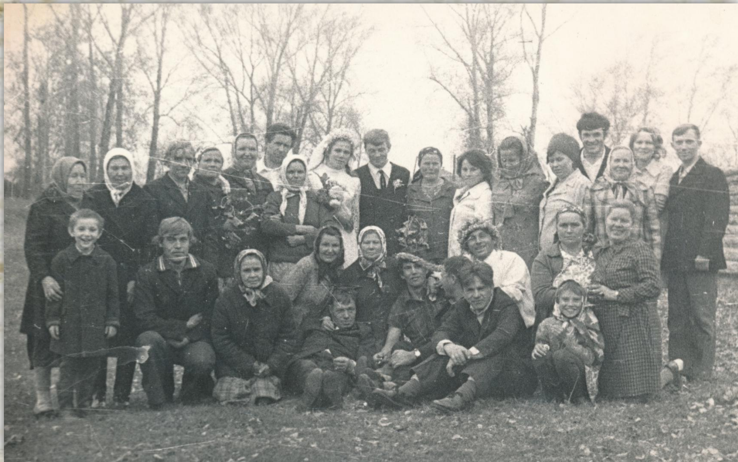
Деревенская свадьба, 1960-е гг.