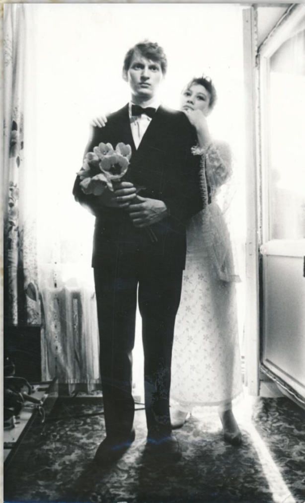
ф.811, оп.1, д.522, л.13