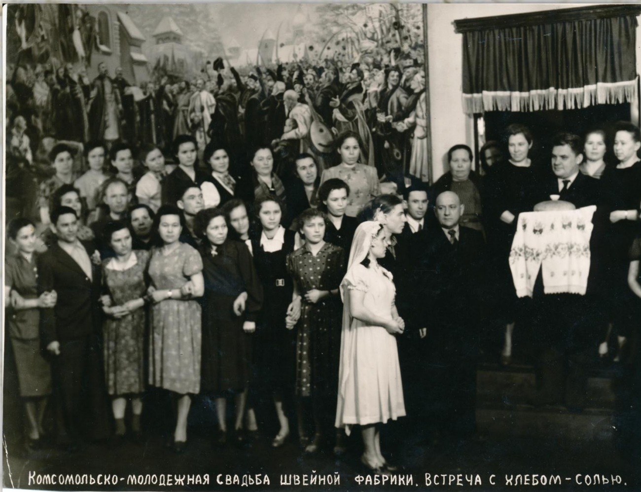
Комсомольско-молодежная свадьба швейной фабрики. Встреча с хлебом-солью.

Комсомольско-молодежная свадьба, 1950-е гг.